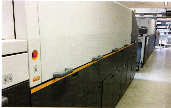
Die beiden Kodak Nexpress Digitaldruckmaschinen sind bei der Colour Connection in einer Linie installiert; im Hintergrund die mit einem Langformat-Hochstapelanleger ausgestattete Nexpress SX3900 .

Ausschnitte aus dem, was Colour Connection mit den Nexpress -Maschinen und der übrigen Produktionstechnik an Printprodukten erstellt, erscheinen im »Digitaldruck Ideen Blog«, der zweimal wöchentlich mit neuen Beiträgen als Ideen- und Inspirationsquelle für Kunden dient. Unter den inzwischen über 1.500 Blog-Beiträgen befinden sich viele, die kreative Druckbeispiele vorstellen, die mit zusätzlichen Farben im fünften Druckwerk der Nexpress produziert wurden. Standardmäßig wird im fünften Druckwerk die Clear Dry Ink als Schutzbeschichtung oder für Wasserzeicheneffekte verwendet.