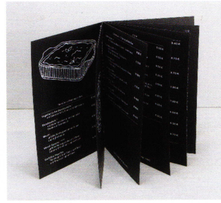
Fotos von Produktbeispielen aus der Produktion der Colour Connection GmbH : Einige wenige aus einer Fülle beispielhafter Printprodukte, die mit den Möglichkeiten der Kodak Nexpress Digitaldruckmaschinen hergestellt wurden und im »Digitaldruck Ideen Blog« des Unternehmens verewigt sind.